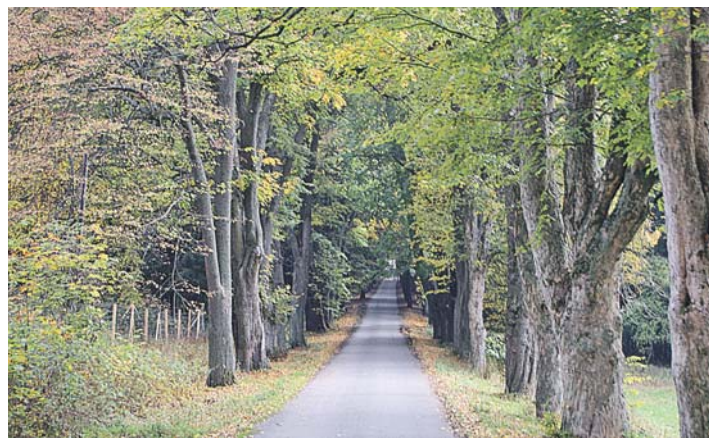
Příjezdová alej se stoletými stromy.

O něco později, ale ještě v téměř století tu vznikly vodoléčebné a klimatické lázně. Ná-