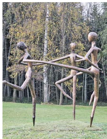
Resort nabízí pro klienty zvýhodněné víkendové pobyty. Více na www.katerinaresort.cz

Z vděčnosti za zachráněný život tu nechal postavit kostel. Na jeho barokní přestavbě se podílel i Kilián Ignác Dientzenhofer a dnes je stavba uznávanou kulturní památkou České republiky.