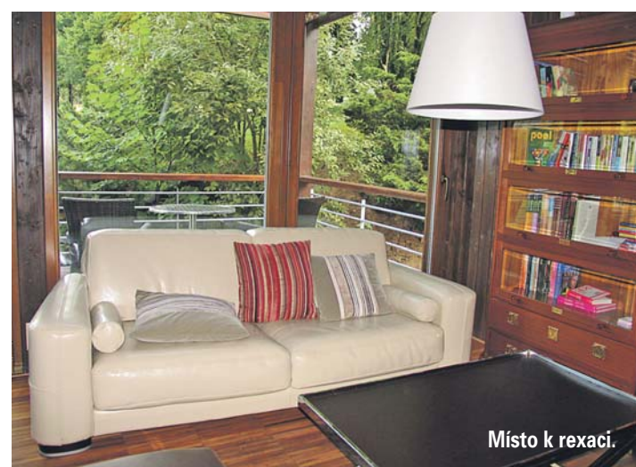
Místo k relaxaci.